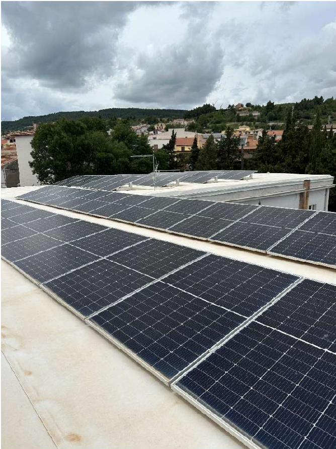
Pacchetto copertura involucro esterno